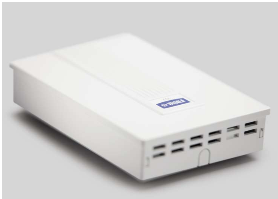
O Transmissor de Dióxido de Carbono GMW115 do Vaisala CARBOCAP® é um transmissor de CO 2 de parede para demanda controlada de ventilação.