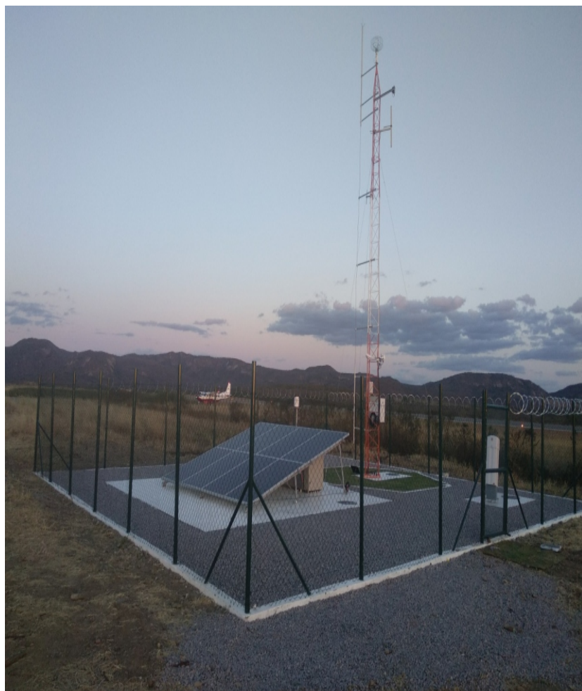
Serra Talhada - PE